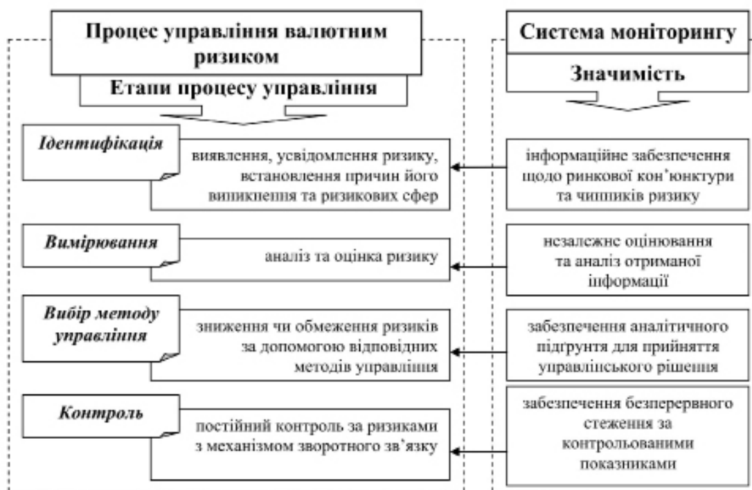
Рис. 2. Процес управління валютним ризиком банку

Складова функціонування механізму – включає процес управління валютним ризиком банку, який складається з декількох основних етапів, які для ефективнішого застосування повинні бути забезпечені системою моніторингу (рис. 2).