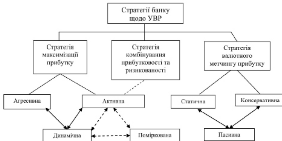
Рис. 3. Класифікація стратегій банку щодо управління валютним ризиком

Вибір методу управління має бути обумовлений обраною стратегією банку щодо управління валютним ризиком, ми розробили власну класифікацію та взаємозв'язки стратегій банку щодо управління валютним ризиком, що допоможе ширше відобразити суть окремих стратегій (рис. 3).