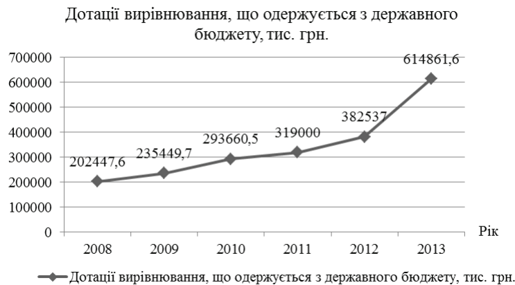
Рис. 2. Статистичні дані дотацій вирівнювання, що одержуються з державного бюджету за 2008–2013 рр., тис. грн.

В 2012 році було надано дотацій на суму 189818,0 тис. грн. Серед них можна виділити: додаткова дотація з державного бюджету на вирівнювання фінансової забезпеченості місцевих бюджетів – 113990,0 тис. грн, додаткова дотація з державного бюджету місцевим бюджетам на підвищення рівня матеріального забезпечення інвалідів I чи II групи внаслідок психічного розладу – 8876,7 тис. грн, додаткова дотація з державного бюджету місцевим бюджетам на покращення надання соціальних послуг найуразливішим верствам населення – 10592,8 тис. грн, додаткова дотація з державного бюджету місцевим бюджетам на оплату праці працівників бюджетних установ – 52286,0 тис. грн, додаткова дотація з державного бюджету місцевим бюджетам на стимулювання місцевих органів влади за перевиконання річних розрахункових обсягів податку на прибуток підприємств та акцизного податку – 4072,5 тис. грн. Останні три дотації в 2013 році не були надані взагалі, так як відбулося суттєве скорочення фінансових потоків затверджених для Сумського регіону.