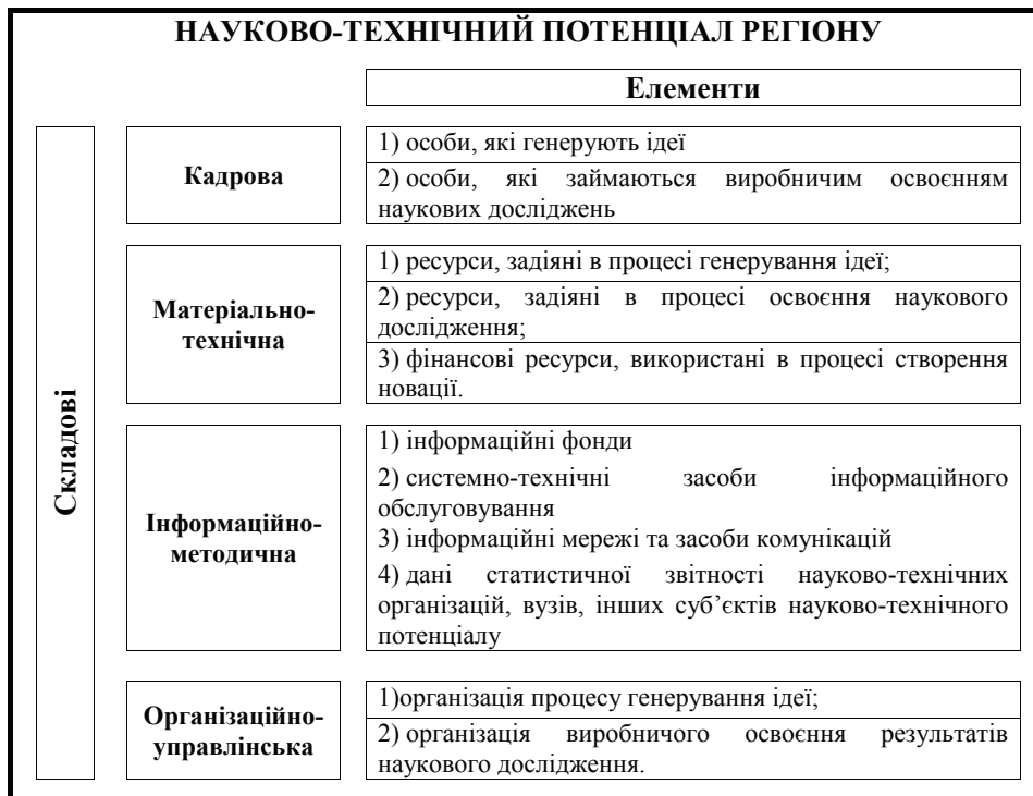
Рис. 1. Структурні елементи науково-технічного потенціалу регіону

Науково-технічний потенціал регіону базується, з одного боку, на власних складових (рис. 1): кадровій, матеріально-технічній, інформаційно-методичній та організаційно-управлінській. З іншого, оскільки регіон слід розглядати як відкриту систему, яка має тісні науково-технологічні, економічні, інформаційні контакти з іншими регіонами країни та зарубіжжя, то він базується на кооперації та інших зв'язках з партнерами щодо створення новачків за угодами, чи через механізм вільної торгівлі ноу-хау, ліцензіями та патентами.