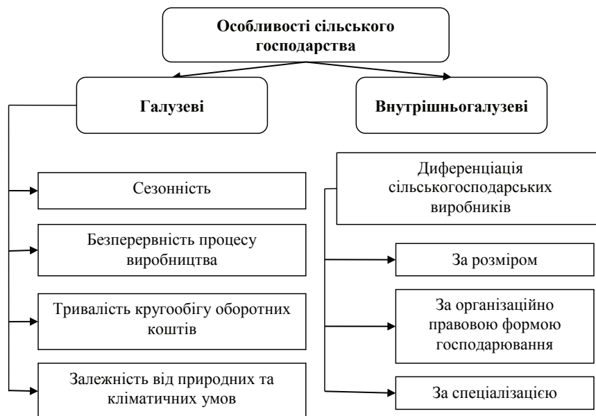
Рис. 1. Особливості організації сільськогосподарського виробництва

Специфіка кредитування сільськогосподарських підприємств, яка знаходиться в безпосередньому зв'язку з галузевими та внутрішньогалузевими особливостями організації самого сільського господарства представлена на рис. 1.