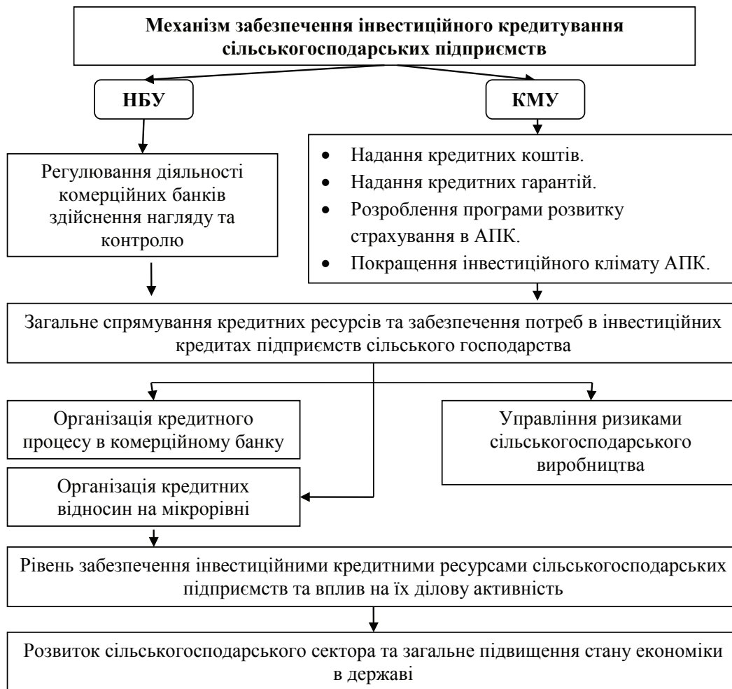
Рис. 4. Орієнтована схема реалізації механізму покращення інвестиційного кредитування сільськогосподарських підприємств