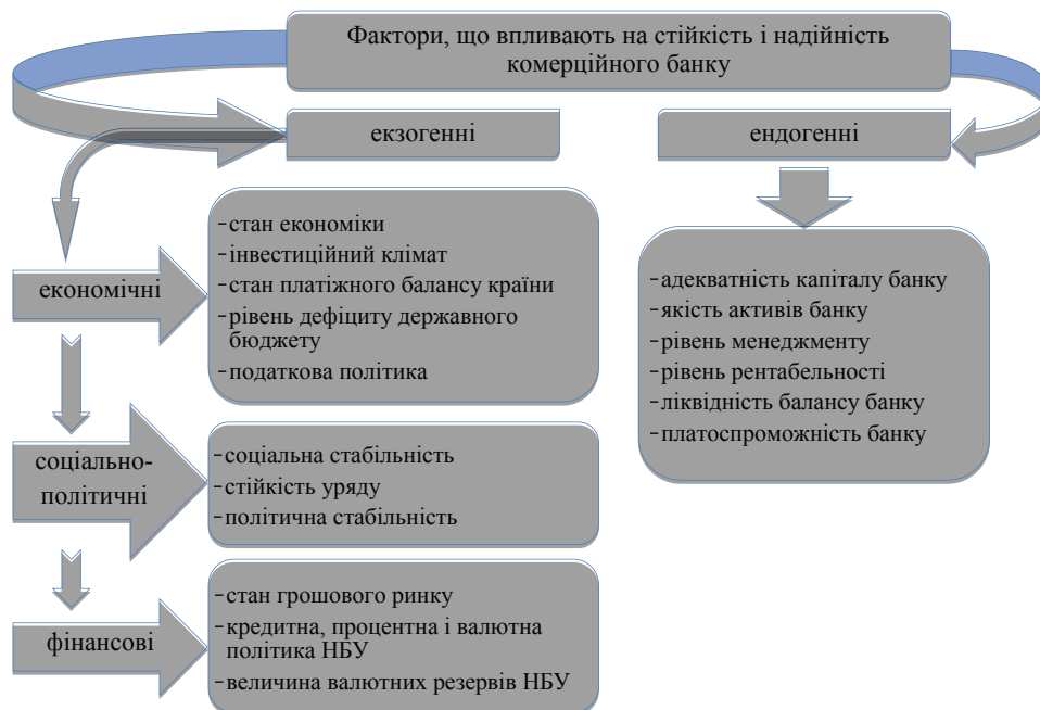
Рис. 1. Система факторів, що впливають на стійкість банку

На сьогоднішній день систематизоване вивчення факторів, що визначають фінансову стійкість банку, не носить закінченого характеру. Разом з тим, видається можливим використовувати досвід, який є в економічній літературі, для систематизації факторів, що впливають на стійкість і надійність комерційного банку. Як справедливо відзначає Р. Шиллер, на сьогодні ще не вироблені чіткі критерії, за якими окремі фактори слід відносити до тієї чи іншої групи, не існує чітких показників оцінки значущості цих факторів. Класифікація факторів, що впливають на стійкість, повинна будуватись за різними напрямками і з урахуванням різних ознак [1]. Особливу увагу при цьому слід приділити виявленню екзогенних (зовнішніх) та ендогенних факторів (які залежать від функціонування самого банку) і визначити ступінь їх впливу на діяльність та стан комерційного банку (рис. 1). Наведені фактори є загальними для всіх комерційних банків й істотно впливають на досягнення ними стану фінансової стійкості. Відповідно, при визначенні напрямків підвищення стійкості банків, доречним є врахування всієї системи факторів.